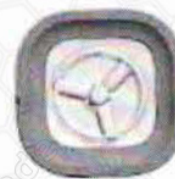
Сливная корзина размещена на крыльчатке

Примечание: Технические характеристики и внешний вид товара могут отличаться, приоритетную силу имеет реальный продукт.