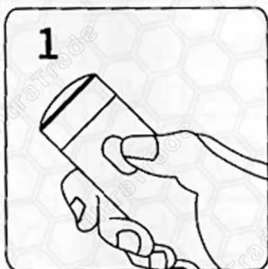
Нажмите кнопку для включения бритвы